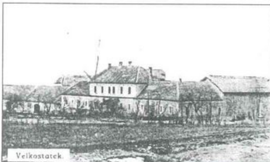
Velkostatek v Uhách na pohlednici odeslané 14.prosince 1926.